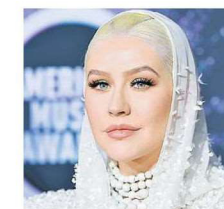
Christina Aguilera Tavolo con ruote di FontanaArte