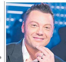
Tiziano Ferro Flash di Altreforme