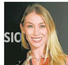
Eleonora Abbagnato Filicudi di Qeeboo