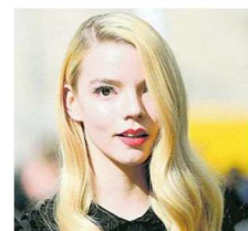
Anya Taylor Joy Kalos di Devon&Devon